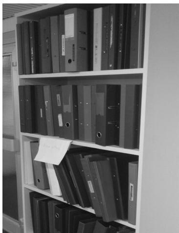
Ilustracja 5. Uniwersytet w Tampere – regał do wymiany używanych segregatorów