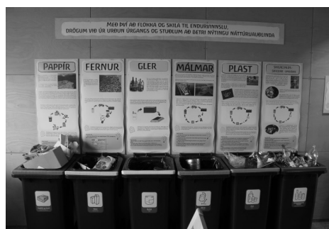
Ilustracja 8. Islandia, wioska Sólheimar – przykład koszy na odpady do recyklingu, z dokładną informacją o każdym rodzaju surowca i jego przetwórstwie.

Dzieje się tak dlatego, że, po pierwsze, Finowie są narodem zdyscyplinowanym i przyjmują ze zrozumieniem konieczność dbania o środowisko, a po drugie – twórcy wymienionych obiektów starają się, aby nie były one uciążliwe: nie wydzielają nieprzyjemnych zapachów, nie emitowały hałasu oraz aby były bardzo estetyczne. Ponadto budowle infrastruktury tego typu wygrywają konkursy architektoniczne i dzięki swojej nowoczesnej stylistyce oraz starannemu doborowi kolorów mogą się podobać, gdyż zdobią przestrzeń miejską. Przykładem tego są fińskie „kosze na śmieci” podłączone do pneumatycznych systemów zasysających odpady do punktów utylizacji (Ilustracja 9.).