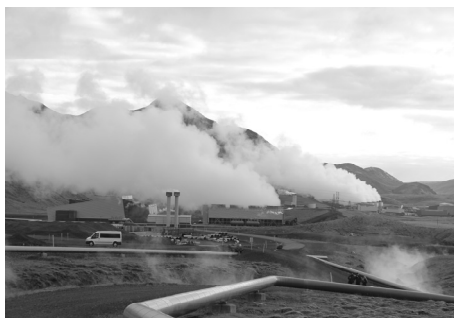
Ilustracja 1. Islandia – Hellisheiði, największa na świecie elektrownia geotermalna.