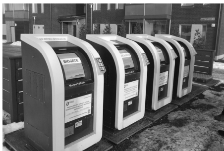
Ilustracja 9. Finlandia, Tampere – pneumatyczne „kosze na śmieci”. Odpowiednio posortowane odpady są w nich zasysane przez system rurociągów do oddalonych nawet o 4 km punktów utylizacji.