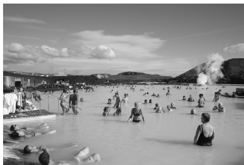
Ilustracja 2. Islandia – Blue Lagoon, najlepsze na świecie SPA lecznicze, „produkt uboczny” i jednocześnie miejsce promocji energetyki geotermalnej.

National Geographic umieścił ją na swojej liście 25 cudów świata, argumentując że "dymiące baseny o turkusowej barwie zamknięte w wulkanicznej pułapce przypominają krajobraz z innej planety". Blue Lagoon otrzymała również wiele innych wyróżnień i tytułów, w tym tytuł najlepszego SPA zdrowotno-termalnego na świecie wg Condé Nast Traveller.