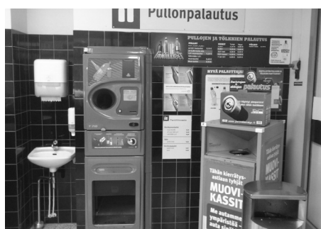
Ilustracja 7. Finlandia– przysklepowy punkt automatycznego skupu butelek plastikowych i puszek aluminiowych po napojach, z informacją o akcjach promocyjnych.

Interesujące jest podejście Finów do infrastruktury związanej z utylizacją odpadów czy produkcją energii odnawialnej. Podczas gdy w Polsce słychać o licznych protestach wobec ulokowania np. elektrowni wiatrowych, biogazowi, oczyszczalni ścieków, o tyle w Finlandii nie stanowi to problemu.