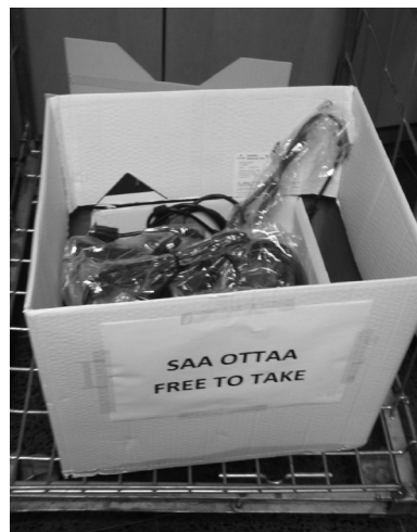
Ilustracja 6. Uniwersytet w Tampere – skrzynka do wymiany używanego osprzętu komputerowego i elektronicznego

Uniwersytet, zgodnie ze swoją misją, popiera zrównoważony transport: jazdę na rowerze, chodzenie pieszo i korzystanie z transportu publicznego. W kampusie wprowadzono możliwość wypożyczania rowerów dla studentów i pracowników uczelni, zorganizowano liczne „parkingi” dla rowerów, ustanowiono również „Dzień Roweru”, podczas którego wynajęci technicy nieodpłatnie naprawiają i konserwują te jednoślady. Wybrane stojaki na rowery są wyposażone w pompki i komplety narzędzi.