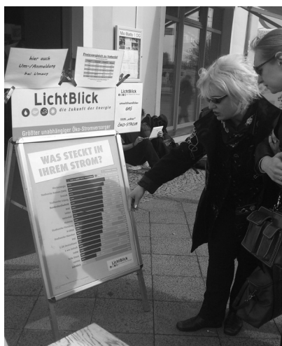
Ilustracja 3. Berlin – przykład ulicznej akcji informacyjnej, zachęcającej do zrównoważonej konsumpcji. Promuje dostawców „zielonej energii”.