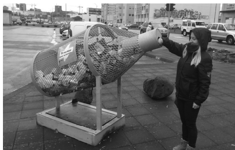
Ilustracja 10. Islandia, Reykjavik – przykład kosza na butelki, opakowania kartonowe i puszki aluminiowe.

Przypominają one do złudzenia szeregi eleganckich bankomatów. Korzystanie z nich wymaga jednak dużej dyscypliny, aby nie uległy awarii. Wynika stąd potrzeba prowadzenia długotrwałej, zintegrowanej akcji informacyjno-promocyjnej, skierowanej do mieszkańców. Poza dokładnymi oznaczeniami i instrukcjami na urządzeniach stosuje się formy komunikacji internetowej, mobilnej (kody QR), infolinię, a także pokazy i szkolenia.