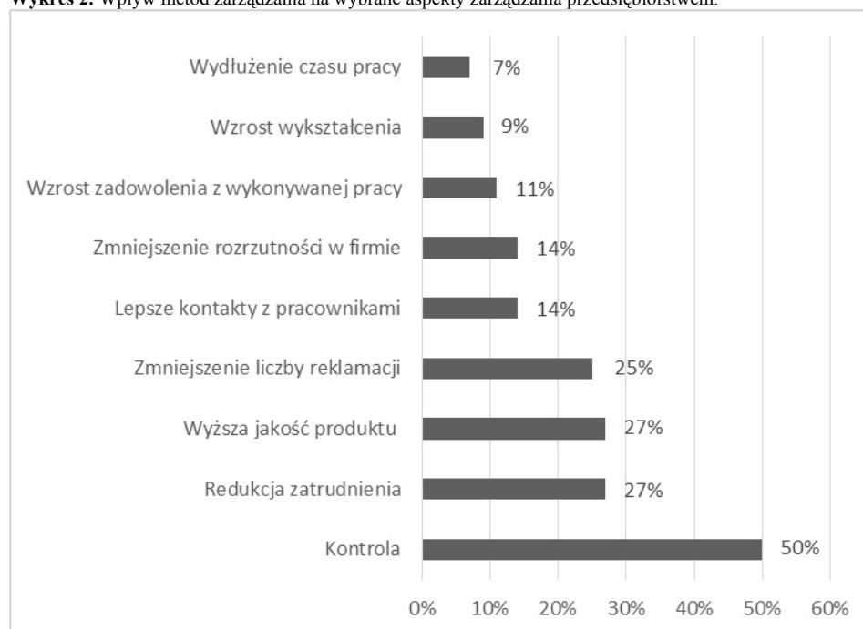
Wykres 2. Wpływ metod zarządzania na wybrane aspekty zarządzania przedsiębiorstwem.